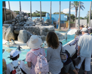
京急油壺マリンパーク見学ツアー