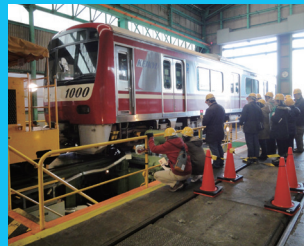
新町検車区見学ツアー

京急電鉄は、株主の皆様へ京急グループの事業について理解を深めていただくため、定期的に株主プレミアムイベントを開催しています。鉄道事業からレジャー事業まで、京急グループの多岐にわたる事業をご紹介します。