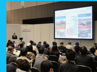
東証IRフェスタ(社長講演)

より多くの個人投資家との対話の機会を設け、当社グループの事業や当社株式の魅力などをご理解いただき、投資のご参考としていただくため、各種IRイベントに参加しています。