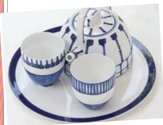
▲藍が美しくモダンなデザインの (Platane)の陶器。

陶器を扱うUrban Tribeや セレクトシヨップのPlatane などは、店内のレイアウトにもセ ンスが光ります。お気に入り雑貨や お土産を探しに行ってみましょう。