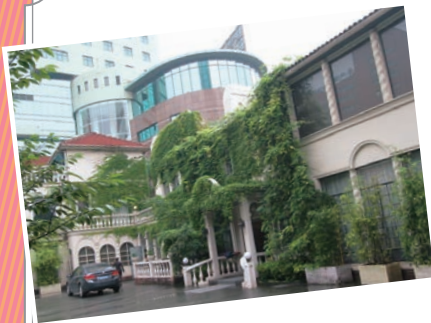
▲旧外国人居留地を中心に、洋館レストランがあり、頤園花園もその一つ。レトロモダンな空間で極上の料理を楽しめるのは上海ならでは。