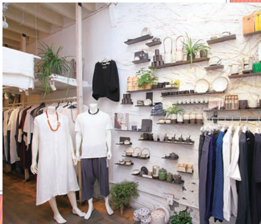
▶センスのよい品揃えの(Urban Tribe)。

上海虹橋国際空港の西側、上海 虹橋駅から地下コンコースでつ ながっている(虹橋天地 THE HUB)は2015年12月のオープン 以来、注目されているスポットで す。食事やシヨッピング、散策が 楽しめる広大なエリアで、イベ ント広場もあります。レストラン やシヨップは地元の人気店が揃 っているほか、地下には大規模フ ードコートがあり、小吃などの日 級グルメも楽しめます。