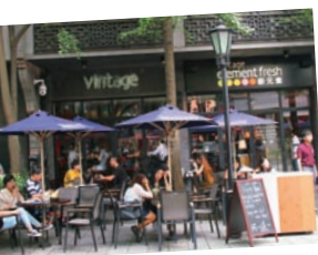
▲新天地にはハイセンスなカフェやショップが揃う。

夜に黄浦江のナイトクルーズや浦東の高層ビルからの夜景を楽しむば、上海観光はひととおりの網羅できます。