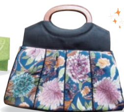
▲シノワズリ(中国風)テイストのバッグとカードケース。