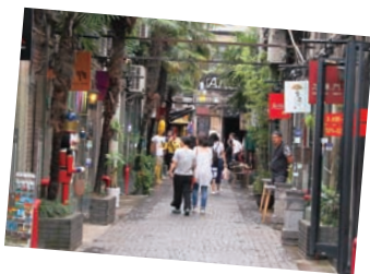
▲写真上/上海の定番観光地になりつつある田子坊。 ▲写真左/老舗レストランやショップが集まる上海の人気観光スポット・豫園商城。清代の建物が建ち並び、昔の上海の雰囲気が残る。