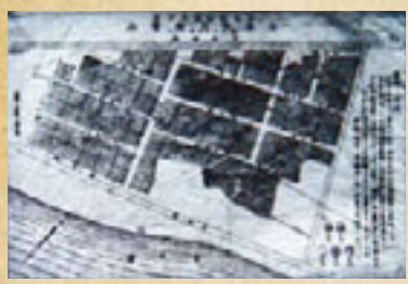
1914年(大正3年)、約1万5,000坪の地を埋め立て売り出された「生麦住宅」。たちまち評判に。

そして、生麦といえば、切つても切り離せないのが、生麦事件。「大河ドラマ『篤姫』」の影響もあって、最近よくお客さまに事件に関するのことを尋ねられます。そのため、我々駅員も実際に発生場所や記念碑を歩いて、事件の知識を深めました。そうすることで、少しでもお客さまのお役に立てれば、うれしいですね。