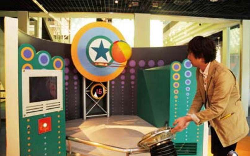
ゲーム感覚で電気について学習できる、東京電力の「トウイニー・シアター」。