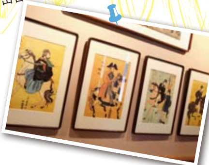
事件に巻き込まれた4人のイギリス人の絵画。馬に乗り、川崎大師へ見物に向かう途中だったと言われる。

1862年(文久2年)8月21日、薩摩藩の大名行列に遭遇したイギリス人一行が切られ、1人が死亡した「生麦