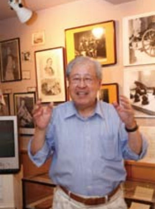
自ら資料を集め、「生麦事件参考館」を開いた浅海館長。近年は講演依頼も多く、全国を飛び回る。

1862年(文久2年)8月21日、薩摩藩の大名行列に遭遇したイギリス人一行が切られ、1人が死亡した「生麦