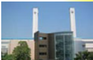
⑥高さ200mの2本の排気塔「ツインタワー」がシンボル。⑦展望台からの眺め。天気の良い日は遠くの富士山まで望める。

●9時30分～17時、月曜日休館(祝日の場合は翌日)、入館無料。横浜市鶴見区大黒町11-1 / Tel.045-511-1222 ※巡回バス運行日には発電所見学会を開催。7月25日(土)、26日(日)、8月22日(土)、23日(日)には体験教室などさまざまなイベントも実施。同日の発電所見学会・タワー見学会は予約不可。