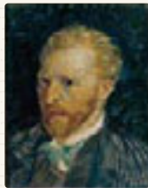
フィンセント・ファン・ゴッホ 《自画像》 1887年

東京・六本木の国立新美術館では、5月26日(水)から8月16日(月)まで、「オルセー美術館展2010-ポスト印象派」を開催します。モネ5点、セザンヌ8点、ゴッホ7点、ゴーギャン9点、ルソー2点を含む、オルセー美術館の傑作絵画115点が出展され、しかも半数以上が同館からの初来日という、またとない鑑賞の機会です。