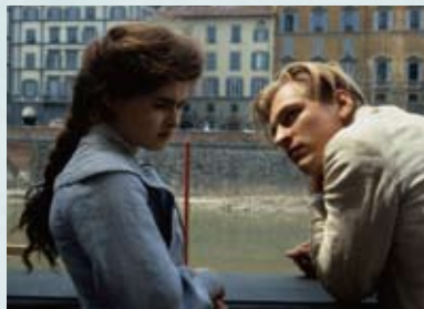
出演:ヘレナ・ボナム＝カーター ジュリアン・サンズ 監督:ジェームズ・アイヴオール (1986年イギリス)