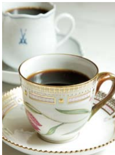
右: 男のエクレア420円(手前)、NYチーズケーキ504円。上: 「ブルーマウンテンNO.1」は、ロイヤルコペンハーゲン「フロラダニカ」など貴重なコーヒーカップで(手前)。左: 曲線が美しいアルネ・ヤコブセンのスワンチェアが印象的な店内。