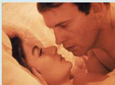
出演:アヌク・エーメ ジャン＝ピエール・ルネ 監督:クロード・ルルーシュ (1966年フランス)

HDニューマスター版 発売元/IMAGICA TV 販売元/エスピーオー 価格/2,980円