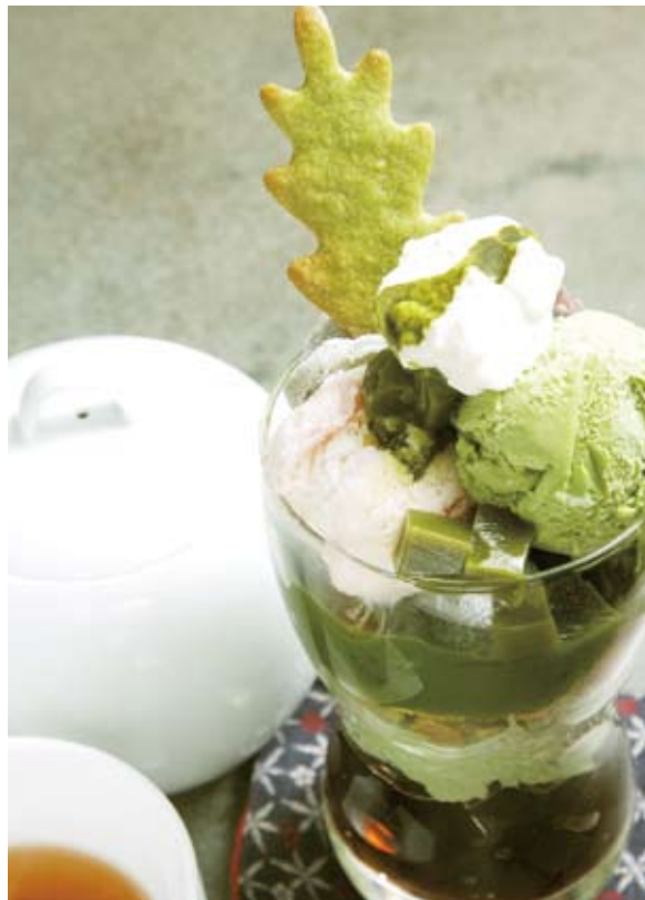
抹茶パフェセットは好みのお茶がつき1,500円。煎茶・ほうじ茶など全11種の中から選べる。写真は手焼きほうじ茶。