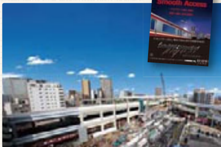
京急蒲田駅および国道15号付近