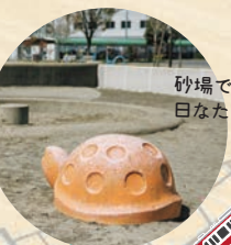
砂場で日なたぼっこ中