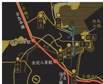
「金沢八景」の由来となった8つの景勝地。 ※「●」の位置はおおよその場所です