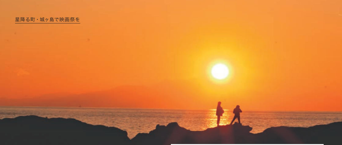
「城ヶ島京急ホテル」の前にある岩場から望む夕日。