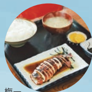
梅一 いか丸定食 1,200円