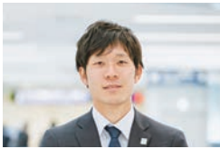
京浜急行電鉄株式会社 鉄道本部 運輸営業部 営業環境デザイン課

ドライバーがスピードを出しすぎないように側面に矢印を施したトンネルや、色の濃淡で小顔になれるメイク方法など、錯覚は日常シーンで活用されつつあるが、案内サインとして駅構内に導入したのは、国内では京急電鉄が初めて。「各地の鉄道事業者や空港、大学などから、方法や効果について多くのお問い合わせをいただいています。国籍や年齢に関係なく、一目で伝えることができ、電力も使わず、床面に貼り付けるだけの錯視サインは、工夫をすればさまざまなシーンで応用できると思います」。2020年の東京オリンピックに向けて、今後錯視サインの活躍が期待できそうです。