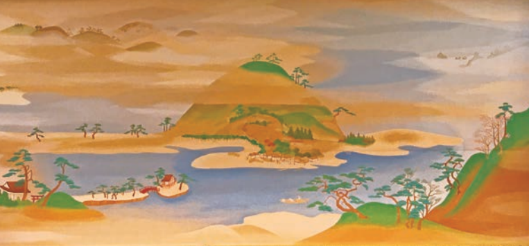
緞帳のデザインは、権現山から見た野島。NHK『よみがえる江戸城』を見た区民からの提案だった。