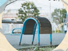
おーい! 空にもいるよ~!