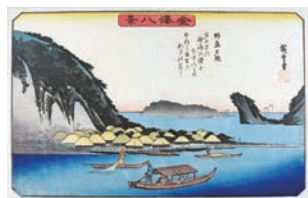
江戸時代の浮世絵師・歌川広重が描いたのは、平潟湾からの野島の眺め。