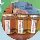
さんご荘の 城ヶ島はちみつ 各1,200円(180g)