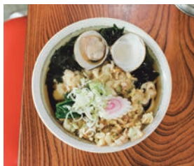
右/バス停前の一等地にある「梅一」。上/「大漁うどん」はボリュームたっぷりで900円。